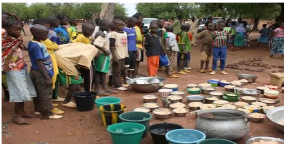
La distribution des repas pour la cantine scolaire

tion ont été ralenties par des problèmes dus au contexte d'insécurité de la région. Aujourd'hui, apprenants, enseignants et communauté éducative contribuent à la réalisation du jardin chaque année. Les avantages sont énormes et importants pour la vie scolaire.