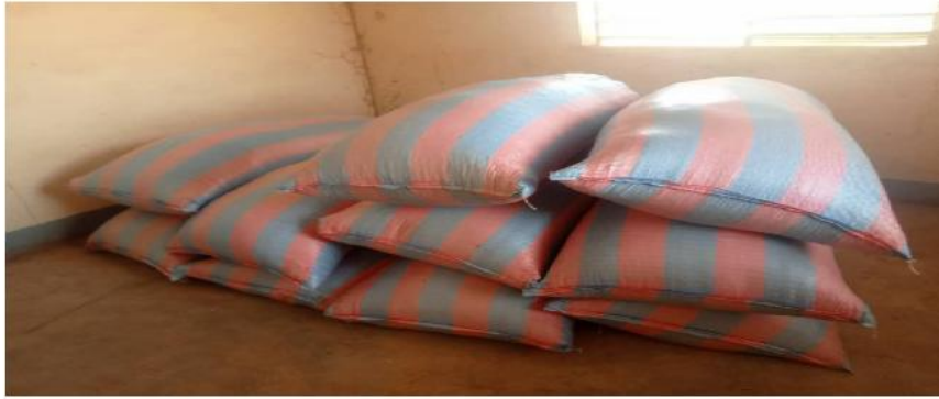
La collecte des vivres après la saison hivernale

Pour la gestion du jardin scolaire, une organisation a été mise en place par le Directeur de l'école. Les élèves du Cours Moyen (CM) et du Cours Élémentaire (CE) arrosent les plantes pendant les heures de leur cours d'activités pratiques du programme scolaire. Tandis que les jours non ouvrables, particulièrement les dimanches et durant les congés sco-