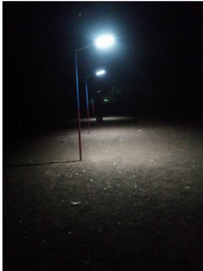
L'électrification solaire de la cour de l'école de Goudrin

Ces résultats probants ont été le fruit des efforts consentis de part et d'autre, des concessions des différents camps pour prioriser le vivre-ensemble dans un monde en panne de valeurs sociales.